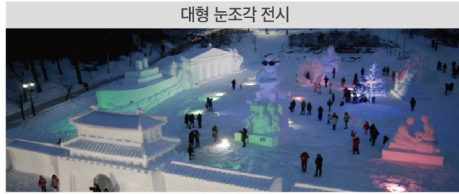
태백산 동심의 겨울놀이터