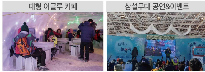
대형 이글루 카페에서 즐기는 따뜻한 차 한잔의 여유