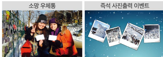
새해 소망을 담은 메시지를 적어 우체통에 넣어주세요!